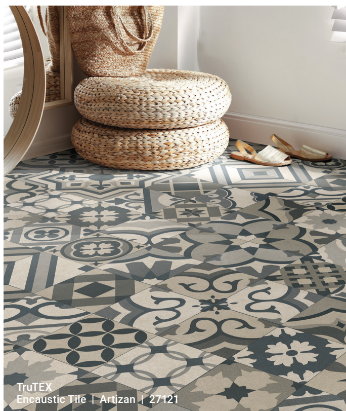
TruTEX Encaustic Tile | Artizan | 27121