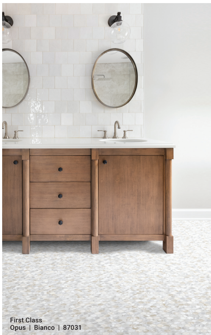
First Class Opus | Bianco | 87031