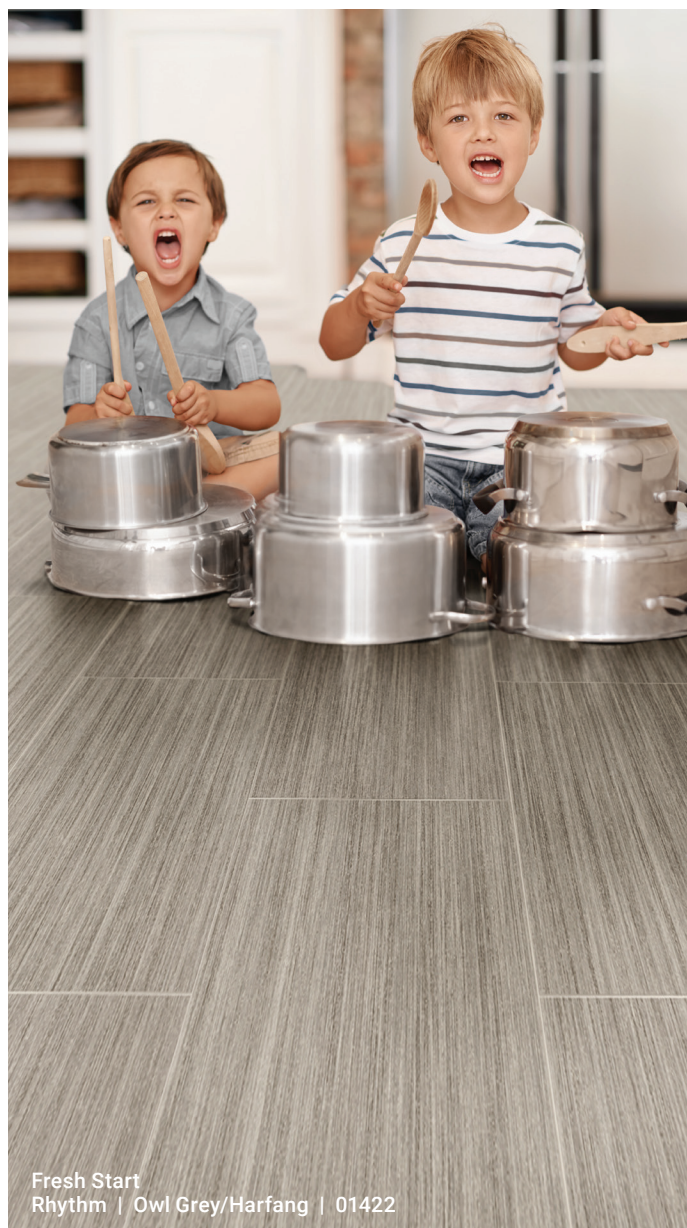
Fresh Start Rhythm | Owl Grey/Harfang | 01422