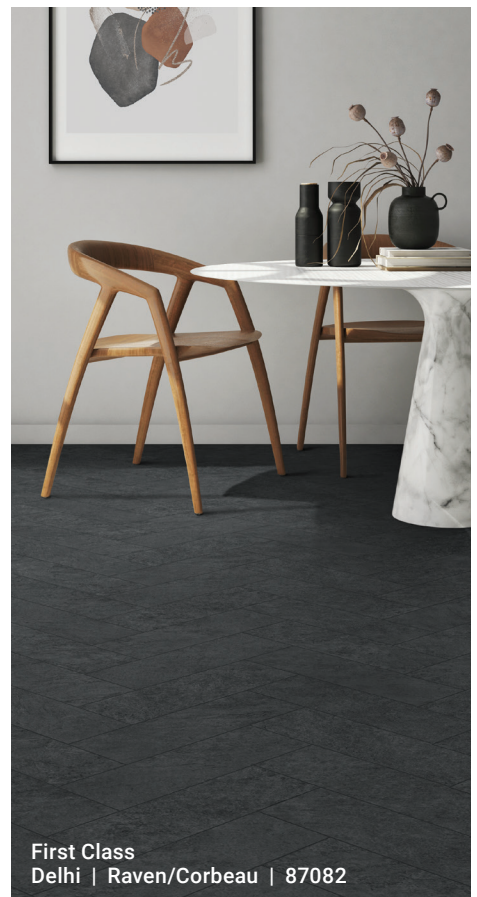
First Class Delhi | Raven/Corbeau | 87082